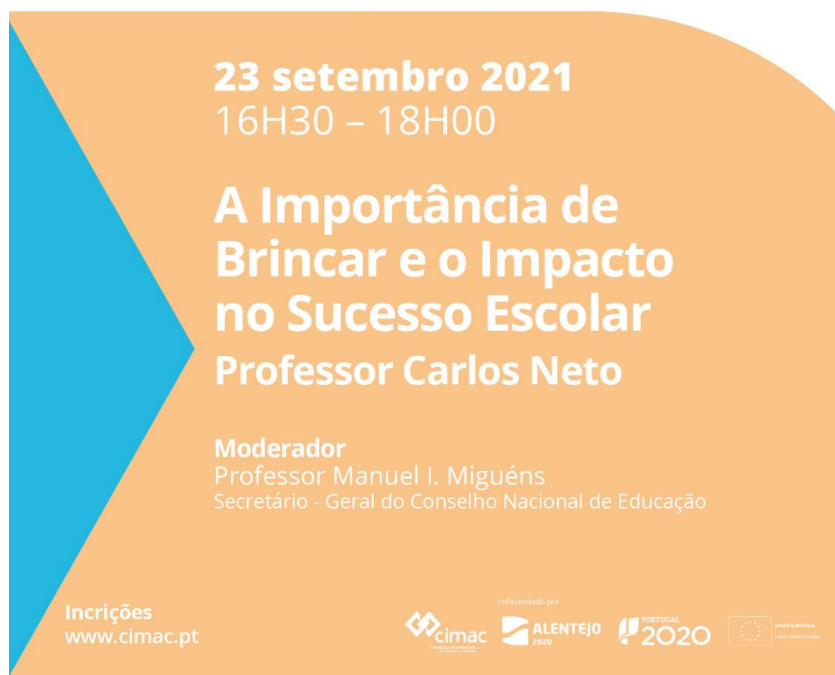
Figura 1 – Programa das Ações de Partilha de Conhecimentos “A Importância de Brincar e o Impacto no Sucesso Escolar”